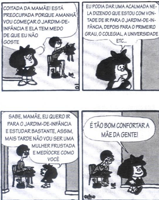
(Mafalda, de Quino)

Para responder às questões 7 e 8 leia a tirinha abaixo.